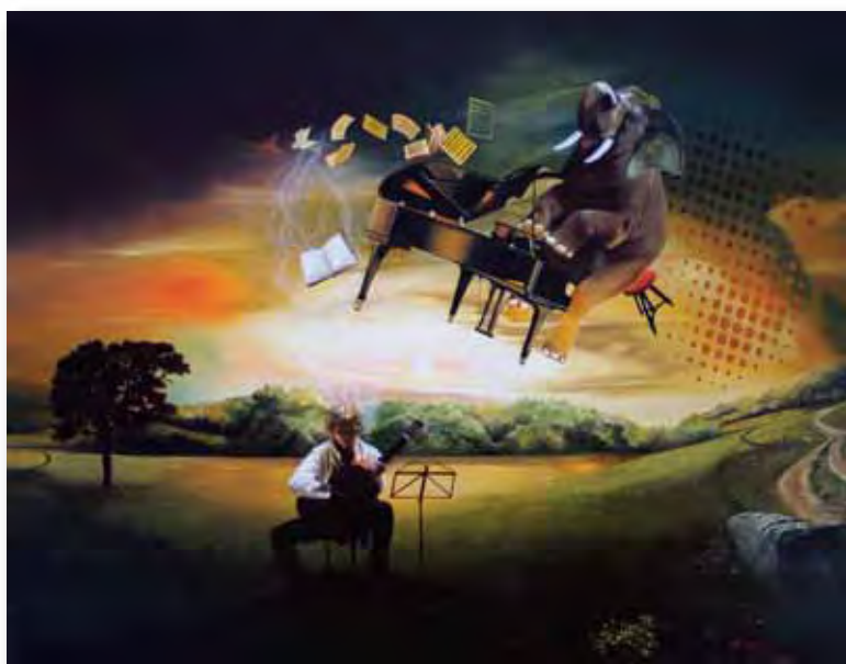
92x73cm - huile