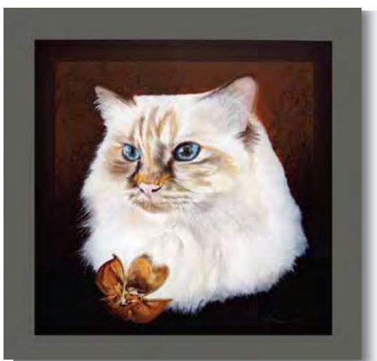
90x90cm - huile