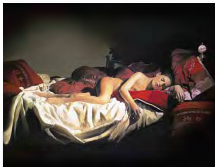
110x81cm - huile