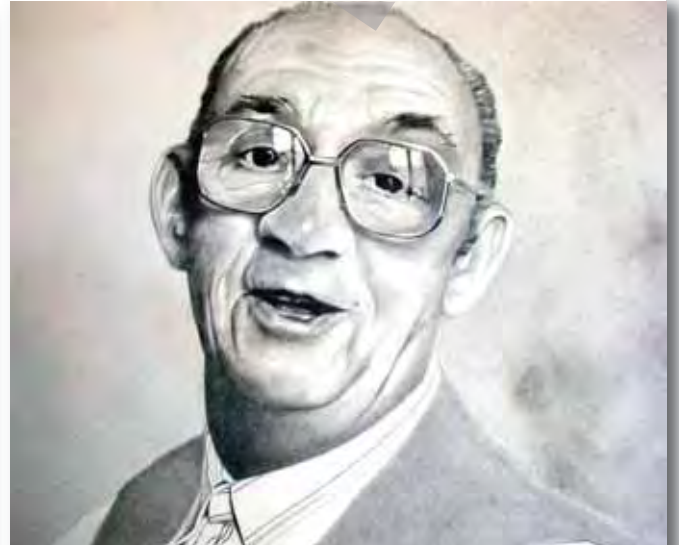
65x54cm - dessin