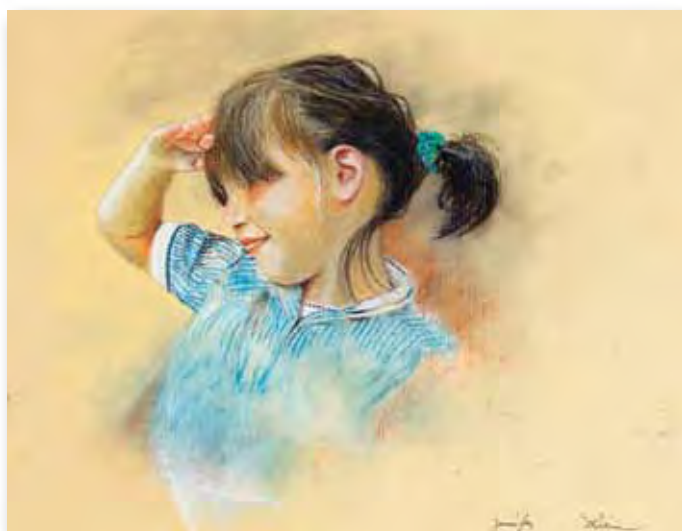
21x29,7cm - pastel