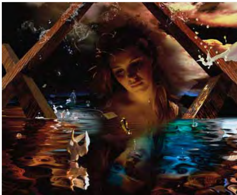
240x180cm - huile