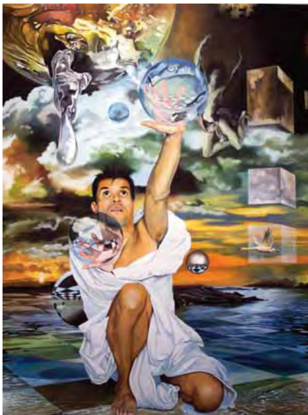
120x90cm - huile