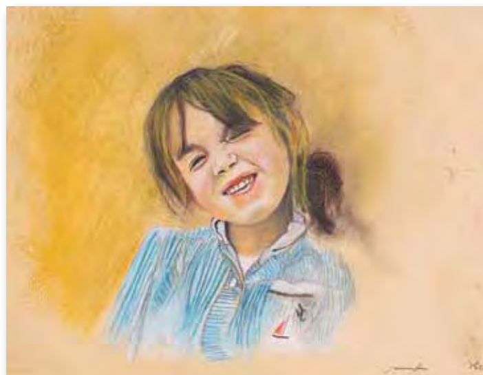
21x29,7cm - pastel