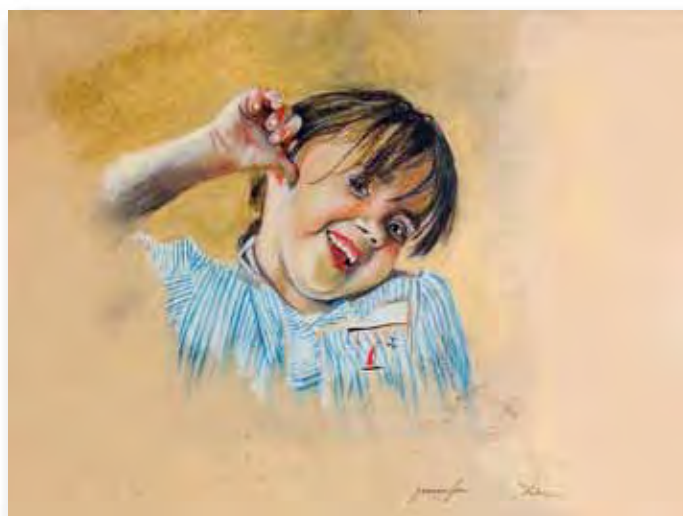
21x29,7cm - pastel