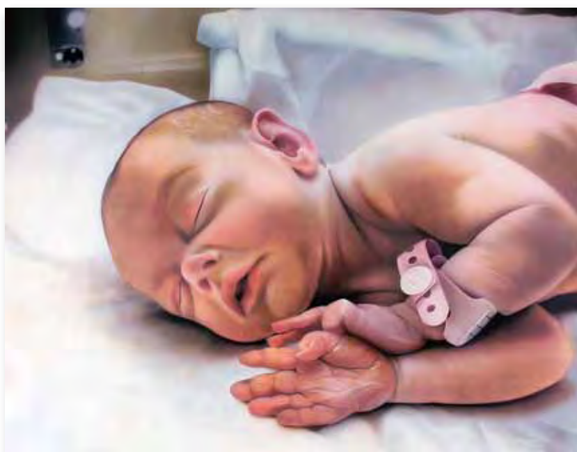
110x80cm - acrylique