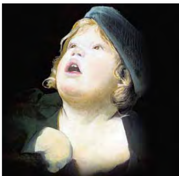
20x20cm - huile