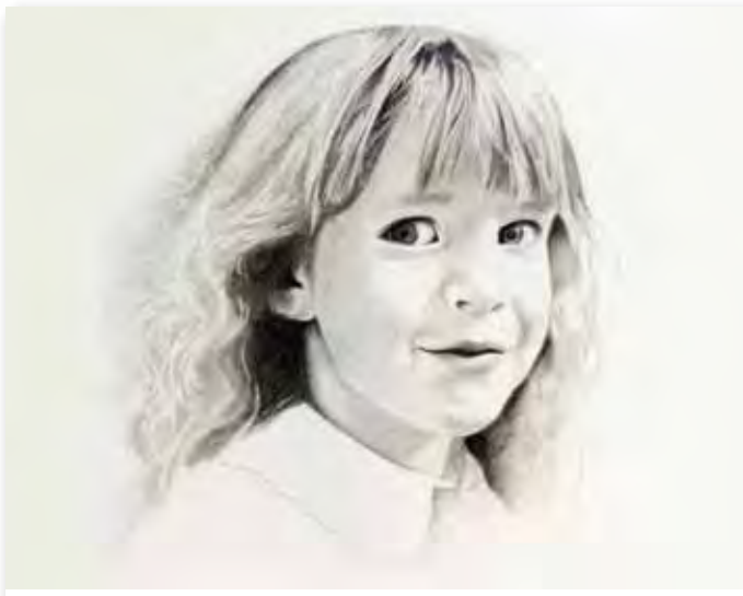
65x54cm - dessin