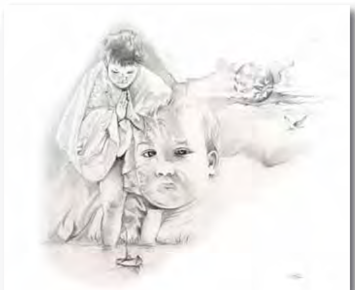
65x54cm - dessin