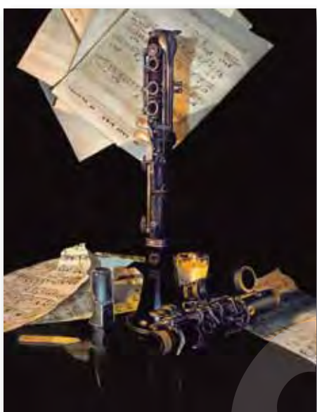
61x46cm - huile