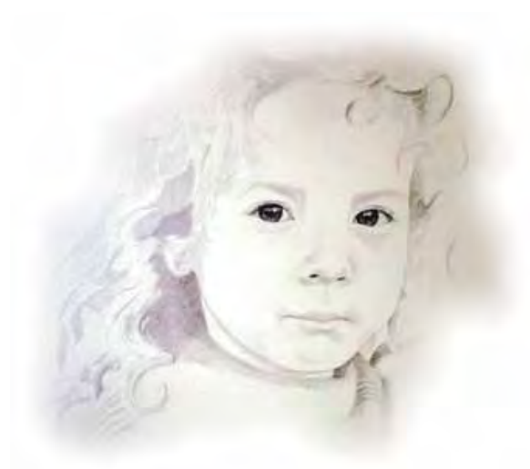
65x54cm - dessin