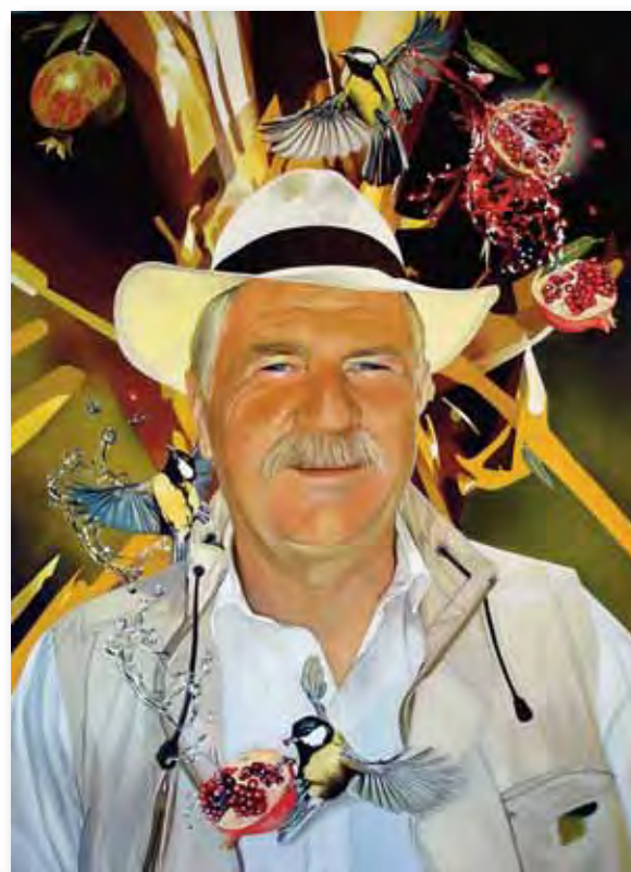
92x60cm - huile