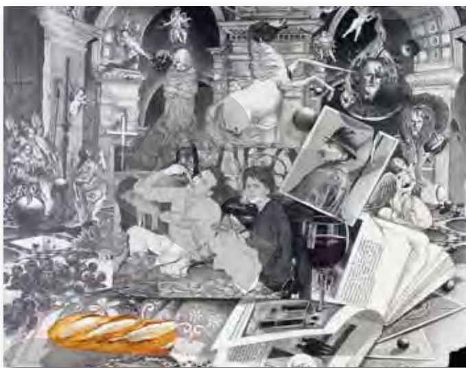
65x54cm - dessin