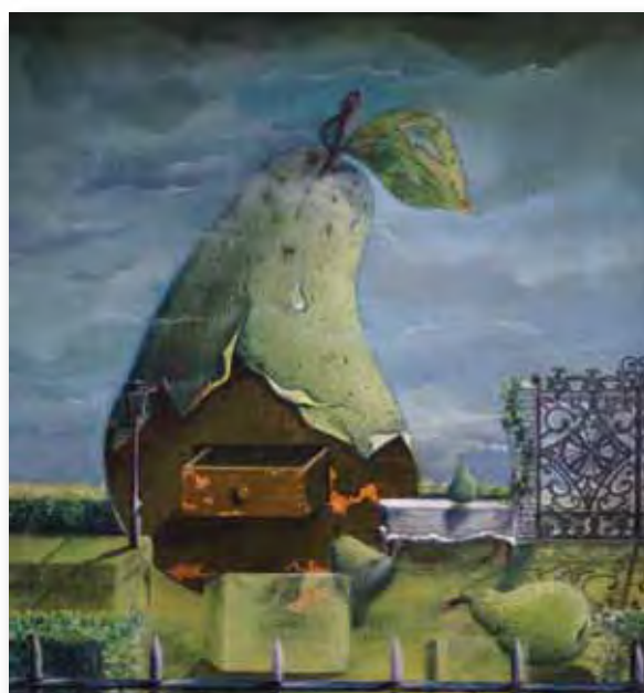
23x23cm - huile