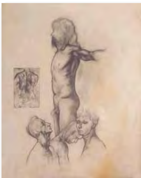
65x54cm - dessin