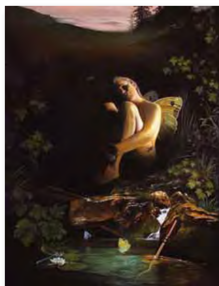
73x54cm - huile