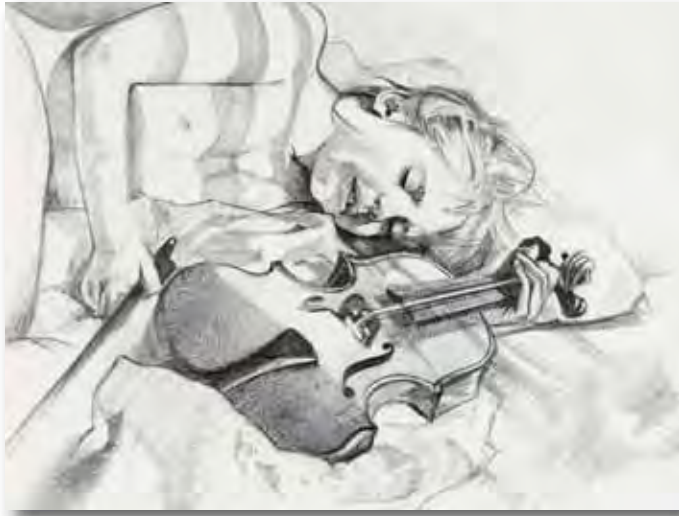
14x9cm - dessin