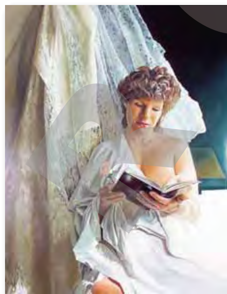
80x62cm - huile